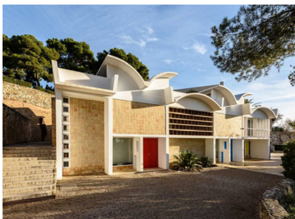
Fundació Miró Mallorca (Palma, )