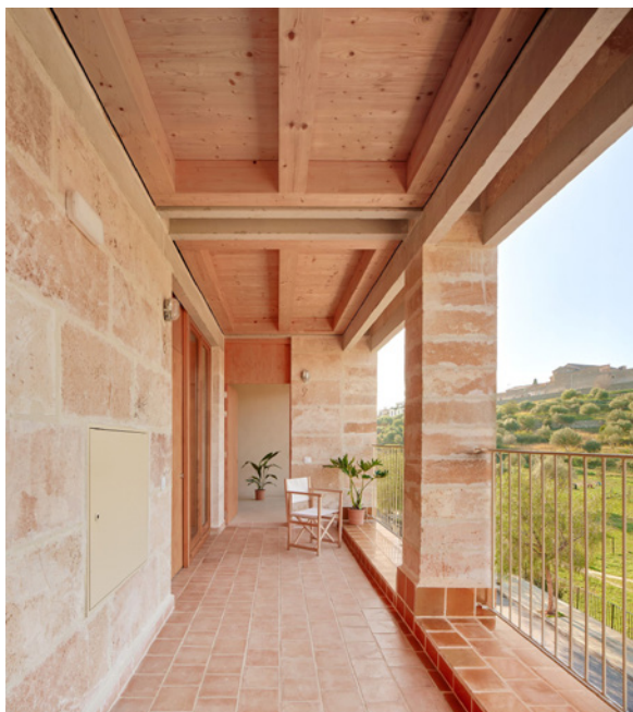
Ripoll Tizon, Estudi E. Torres Pujol, Martorell Estruch, 9 logements sociaux pour l'IBAVI (Inca, 2023)