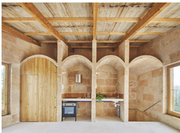
IBAVI, 19 logements sociaux (Salvador Espriu, Palma, 2023)