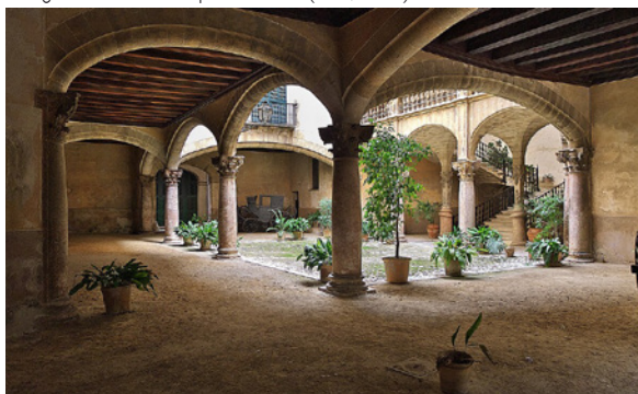
Can Vivot (Palma, XVII ème siècle)