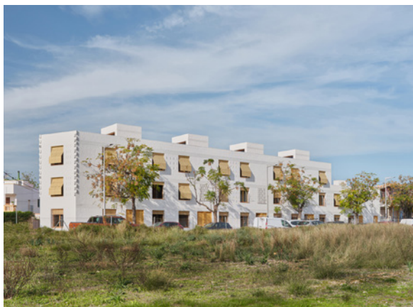
Carles Enrich Studio, 11 logements sociaux pour l'IBAVI (Palma, 2024)