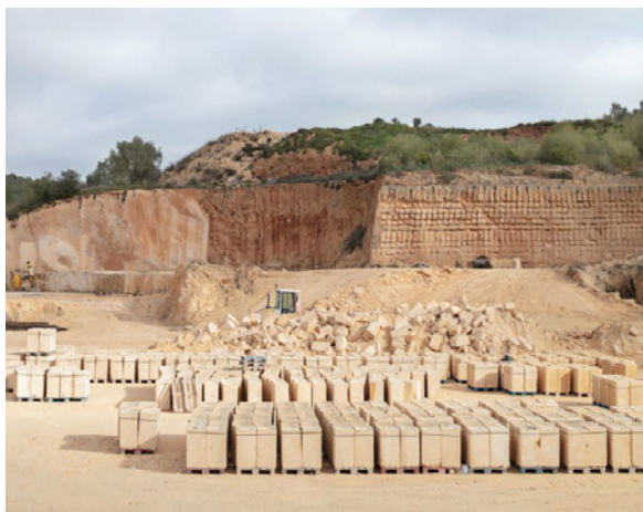
IBAVI, 19 logements sociaux (Salvador Espriu, Palma, 2023)