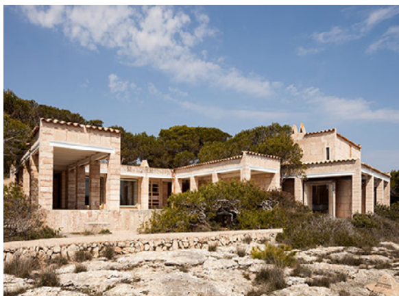
Can Lis, Jorn Utzon (Portopetro, 1971)