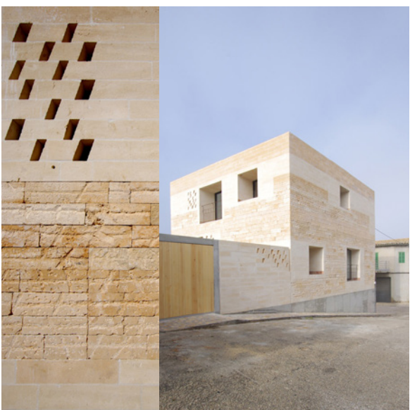
Ted'A, Can Jordi Africa (Montuiri, 2023)