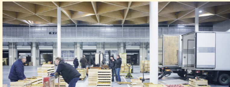
Le MIN de Nantes Métropole - Erik Giudice architectes